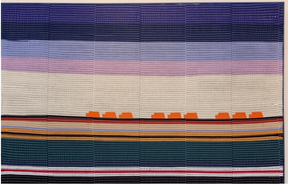
«Колонна» по мотивам картины Казимира Малевича «Красная конница»