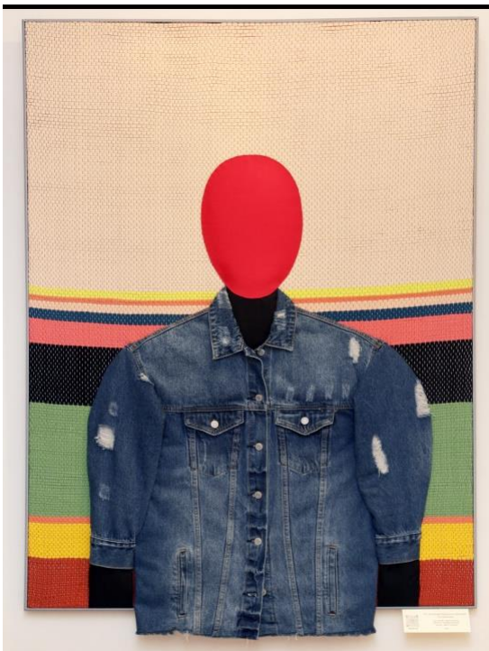
«Человек без лица» по мотивам картины Казимира Малевича «Женский торс»