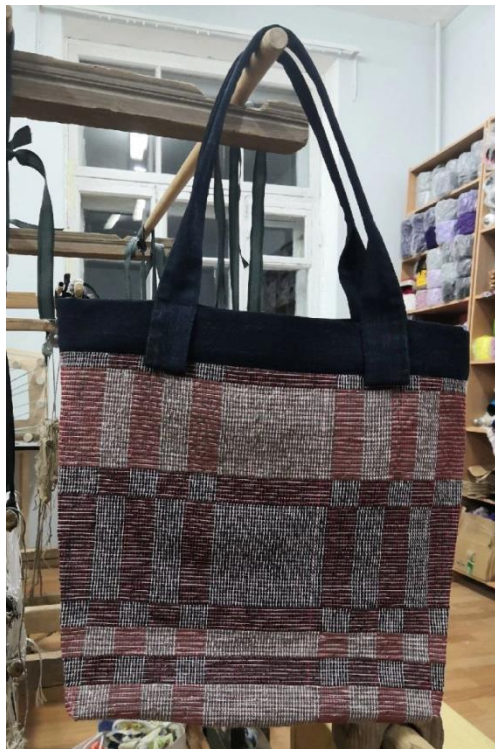
Сумка из п/э

Второе наше направление. Создание линейки тканых интерьерных изделий и сувениров. Первая наша линейка это «Пряник Манифактурный»