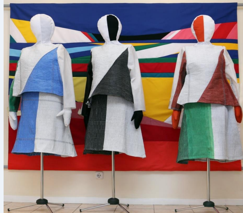
Инсталляция по мотивам картины Казимира Малевича «Три девушки в поле».